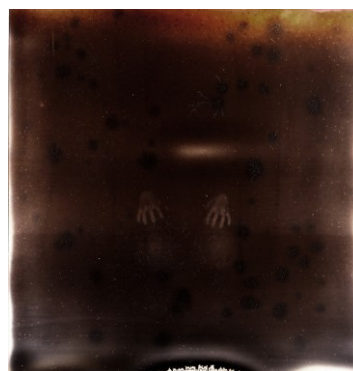
Edge of Reality #2 Polaroid, 11x9cm, 2014