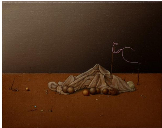
Alex Ball, Settlement, 2009, oil on linen, 16x20cm

Grown up in late 20 th century and living in the 21 st century, the three artists have to express