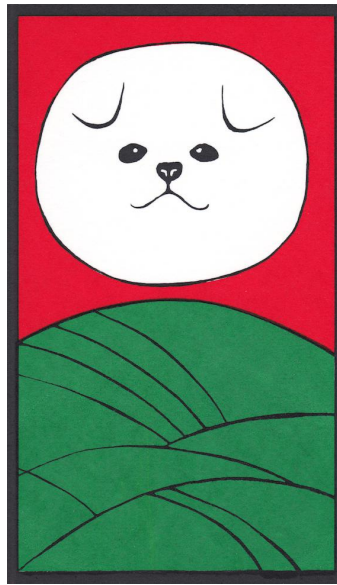
左) 秋田犬花札 五月 菖蒲にハツ橋 2019 28×25cm シルクスクリーン ed.8 右) 秋田犬花札 八月 芒に月 2019 28×25cm シルクスクリーン ed.8