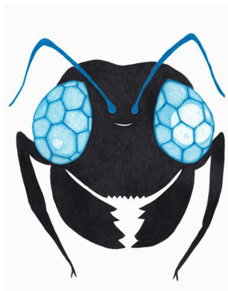
左) おばけフクロウ 2018 7×5.5×8cm セラミック 右) ありのめに月 2017 34×25.5cm 紙に色鉛筆