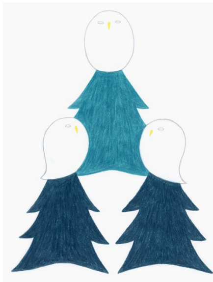
おばけフクロウの森 2019 31×24cm 紙に色鉛筆